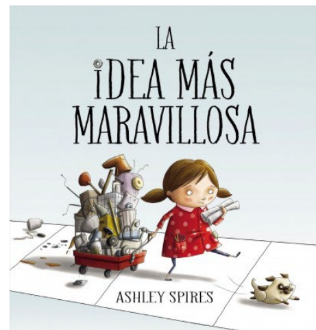
La Idea Más Maravillosa, (Spires, 2017)